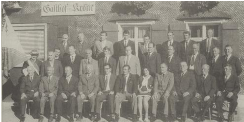
Männerchor im Jahre 1970 in Übersaxen (Vorarlberg)