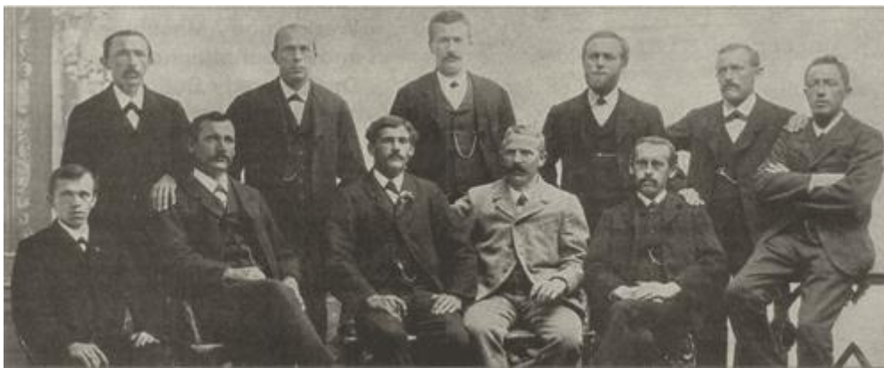
Gründungsfoto des Männerchores aus dem Jahre 1896

Eine Chronik dient dazu, Vergangenes zu bewahren und für die kommenden Generationen festzuhalten. Umfasst diese Rückschau wie im vorliegenden Fall über 120 Jahre, so kann sie sich jedoch nur auf die von den Chronisten für wesentlich gehaltenen Ereignisse festlegen. Die vielen mittleren und kleineren Höhen und Tiefen in der wechselvollen Geschichte des Männerchors Rüthi bleiben damit grösstenteils unberücksichtigt. Aber vor allem ergeben sie zusammen mit den nachfolgenden Höhepunkten aus der Geschichte ein abgerundetes Gesamtbild.