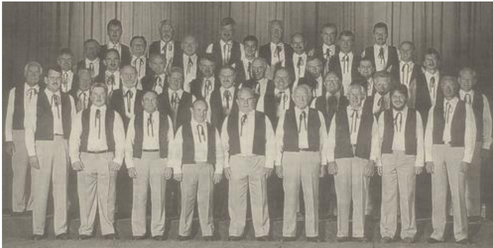
Männerchor anlässlich 100-Jahr Jubiläum im Jahre 1996

100 Jahre Vereinsgeschichte müssen gefeiert werden. Deshalb wurde ein dreitägiges Jubiläumsfest organisiert. Beim grossen "Grand Prix der Volksmusik" der Dorfvereine war am Freitag das ganze Dorf auf den Beinen und feierte mit dem Männerchor das Jubiläum. Der Samstag war dem Tanz und der Unterhaltung gewidmet und am Sonntag wurde der Rheintalische Sängertag mit über 700 Sängern durchgeführt.